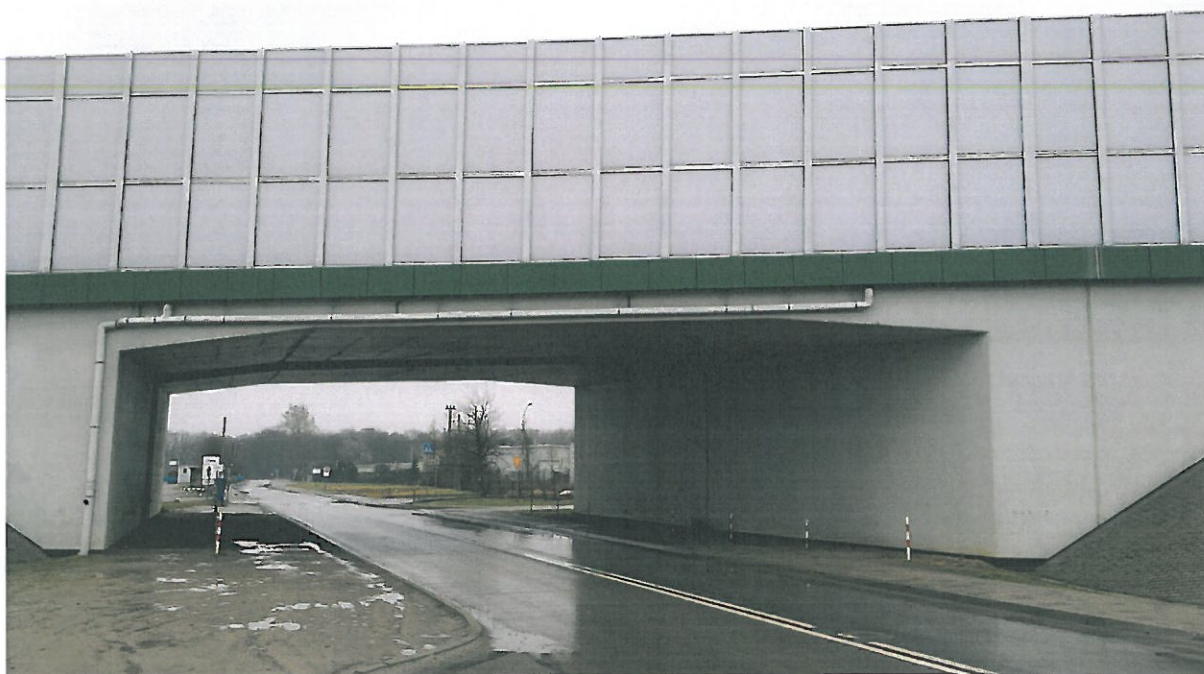
Wiadukt W13 w km 470+336 nad ulicą Spichlerzową