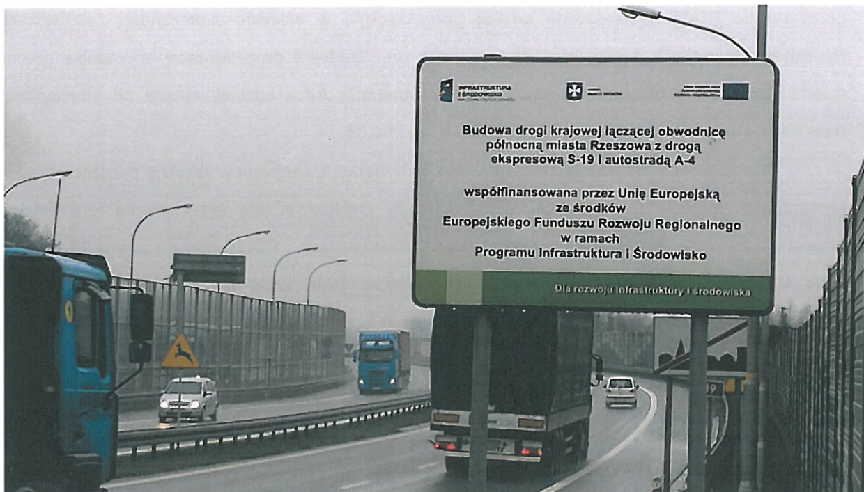
Tablica pamiątkowa usytuowana przy drodze krajowej nr 19

zgodne z warunkami określonymi w Zasadach promocji projektów dla beneficjentów POIiŚ 2007-2013.