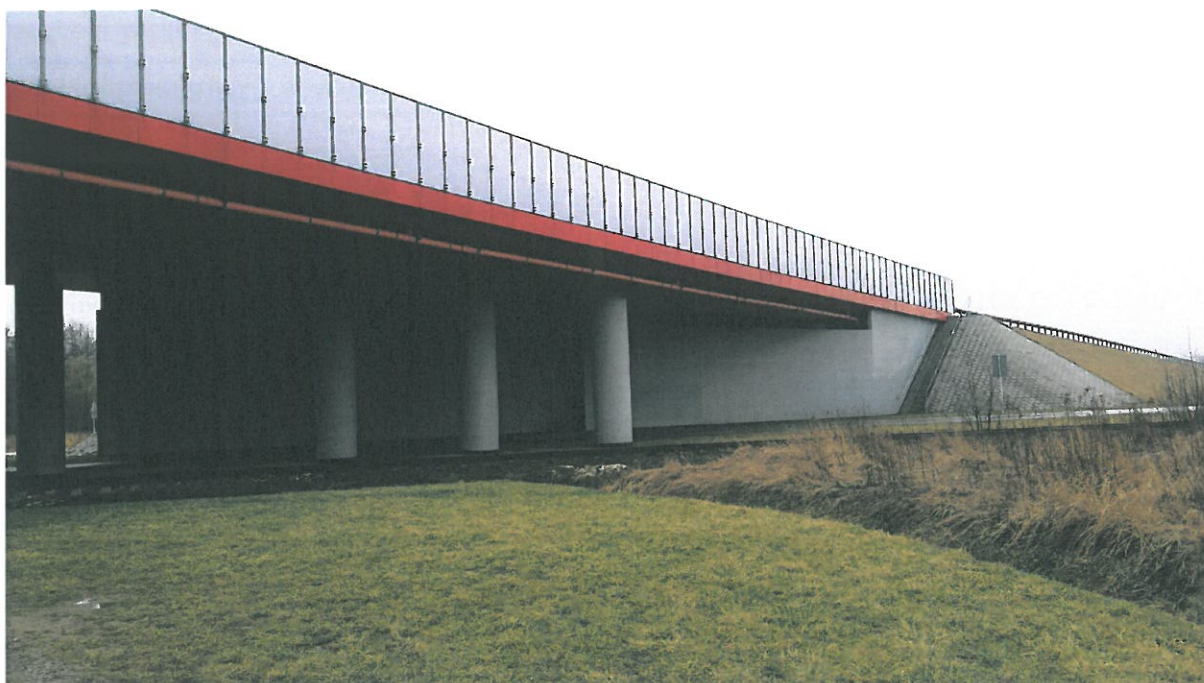
Wiadukt W14 w km 470+762 nad bocznicą kolejową i drogami dojazdowymi