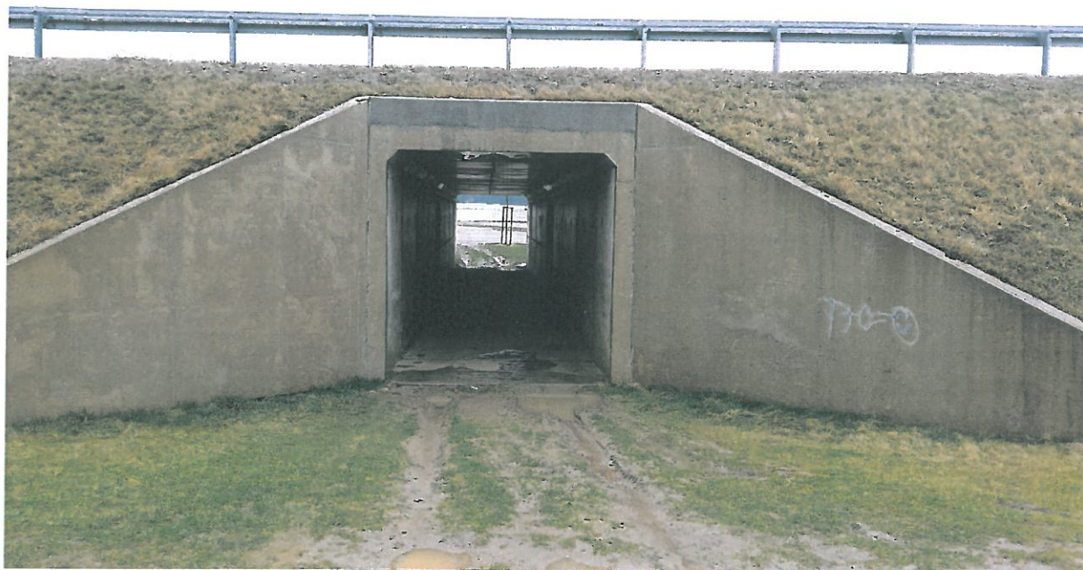
Przeput drogowy żelbetonowy, przejście dla płazów w km 470+150