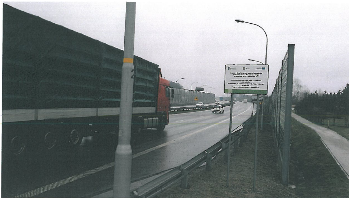
Tablica informacyjna zlokalizowana przy drodze krajowej nr 19

W dniu 22.03.2017 r. przeprowadzono oględziny miejsca zrealizowanej inwestycji i sporządzono dokumentację fotograficzną stanowiącą załącznik do akt kontroli.