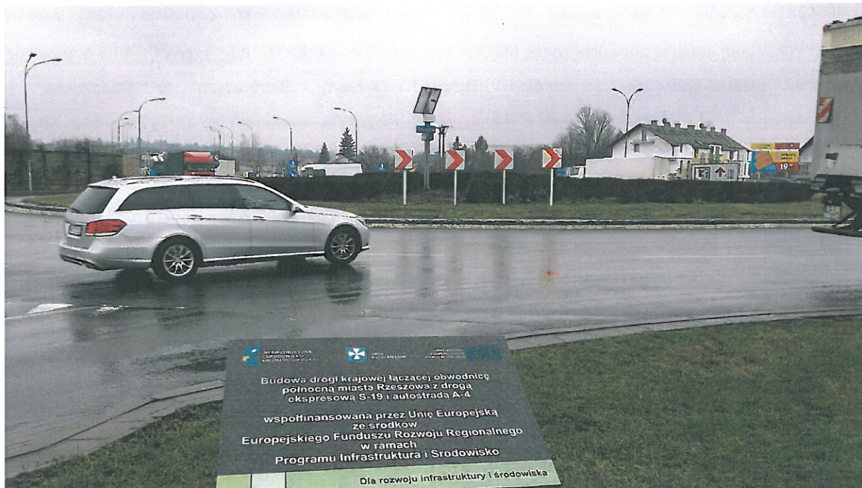
Tablica pamiątkowa zamieszczona przy rondzie Kuronia