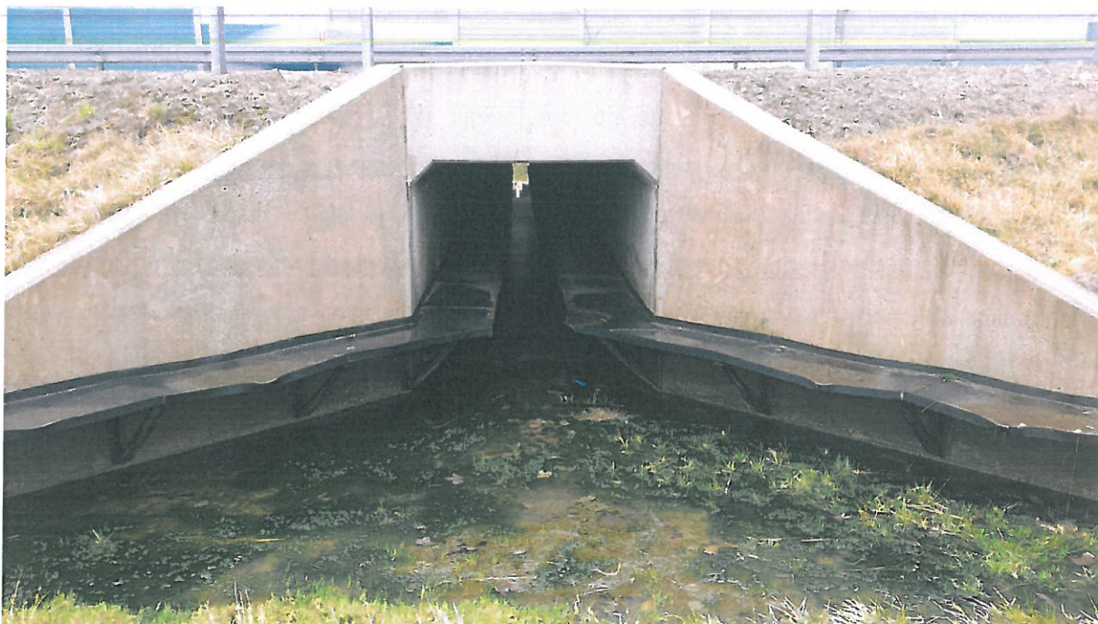
Przeput drogowy żelbetonowy, przejście dla płazów w km 471+304 z półkami